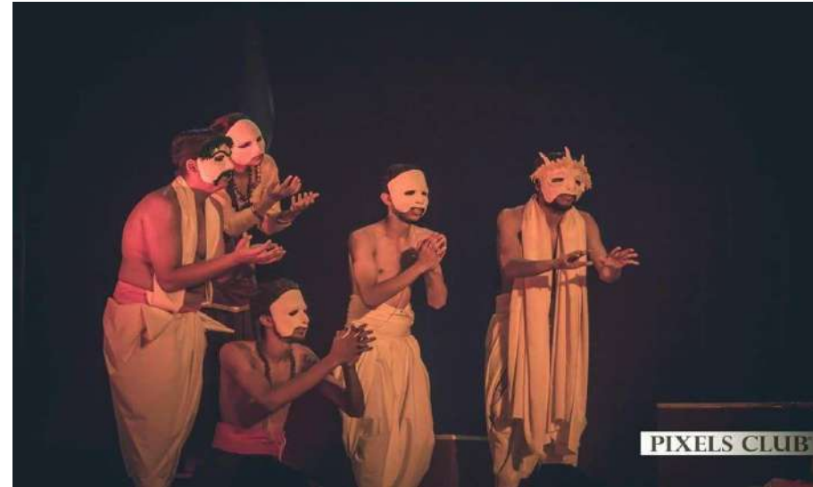
PLAY AGNI AUR BARKHA