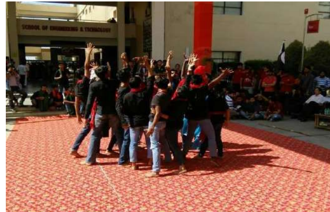
NUKKAD NATAK WON FIRST PRIZE IN CHITKARA UNIVERSITY