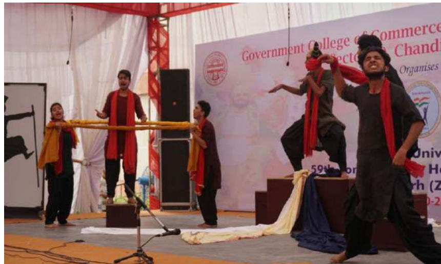
SKIT ON EDUCATION SYSTEM