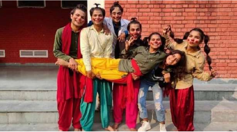
ZEITGEIST 2020 SKIT GOT FIRST PRIZE