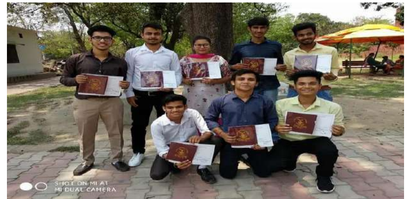
ROLL OF HONOR