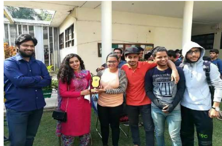
SKIT GOT FIRST PRIZE IN PECFEST