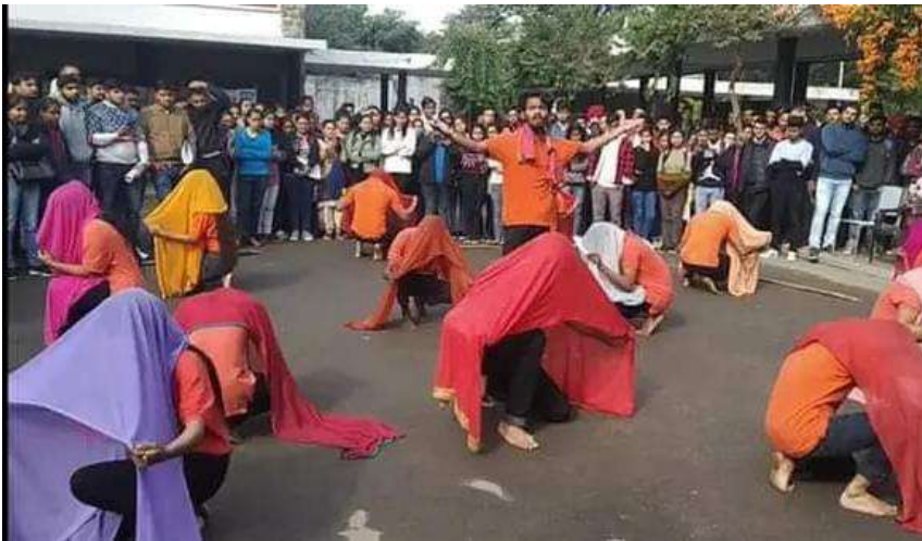
NUKKAD NATAK ON VOTING

YUVFORIA AMRITSAR UNIVERSITY PRIZE- 1 ST POSITION