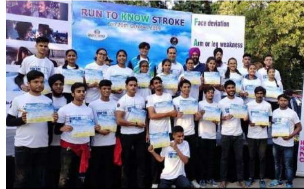
PERFORMING NUKKAD NATAK AT SUKHNA LAKE FOR NGO