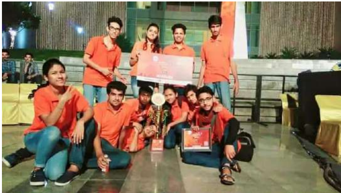
INTER COLLEGE SKIT COMPITION ,FIRST PRIZE