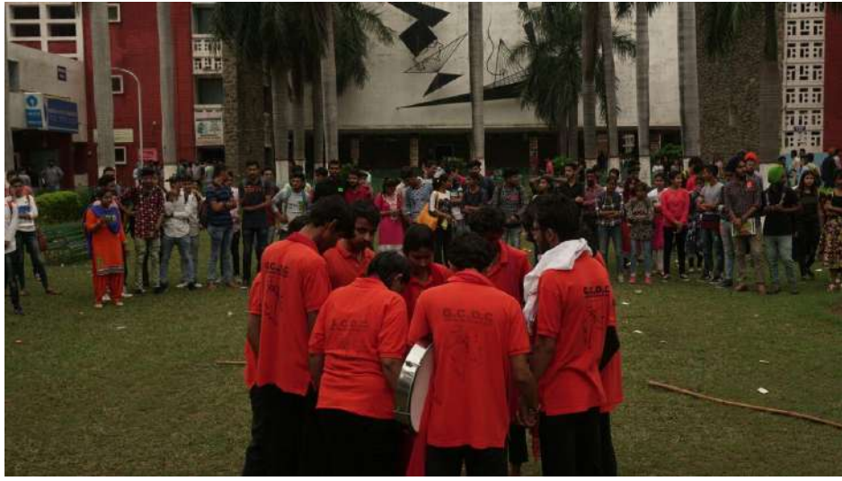
ANNUAL NUKKAD ON SUCIDIES IN INDIA