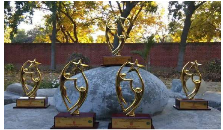
AD MAD FIRST PRIZE