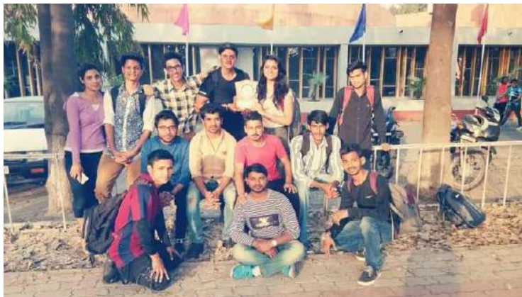
HIMSU AWARD OF HONOR ,GUEST PERFORMANCE