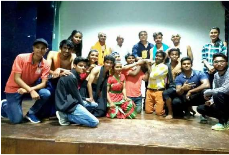
PLAY CHANAKYA WON FIRST PRIZE AT PECFEST