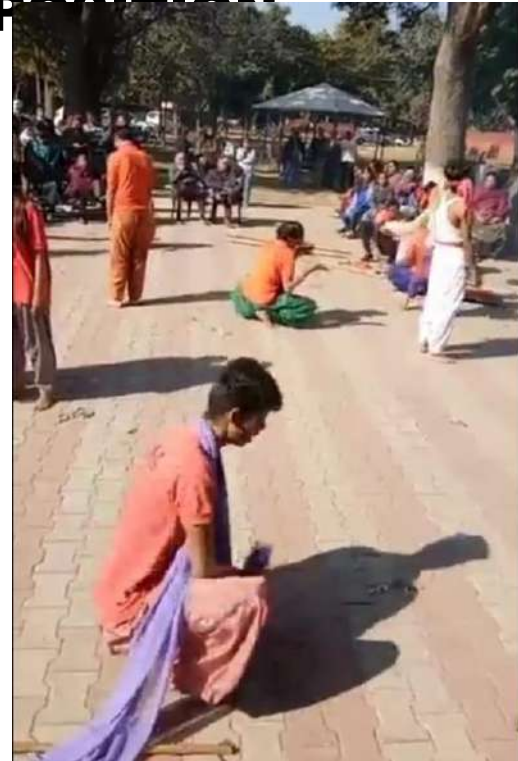
NUKKAD NATAK ON SUICIDE